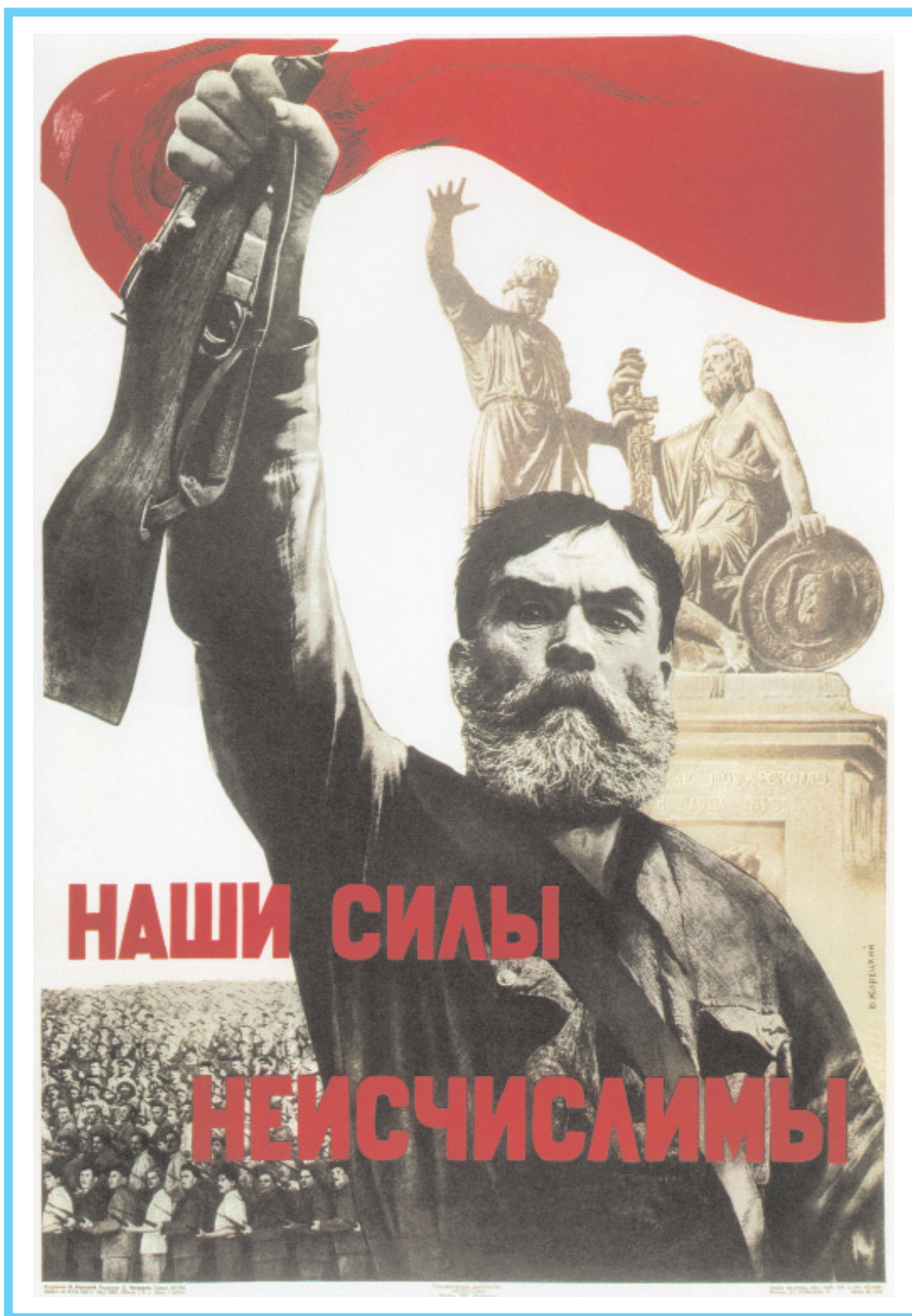
Плакат "Наши силы неисчислимы". Художник В. Б. Корецкий, 1941 г.