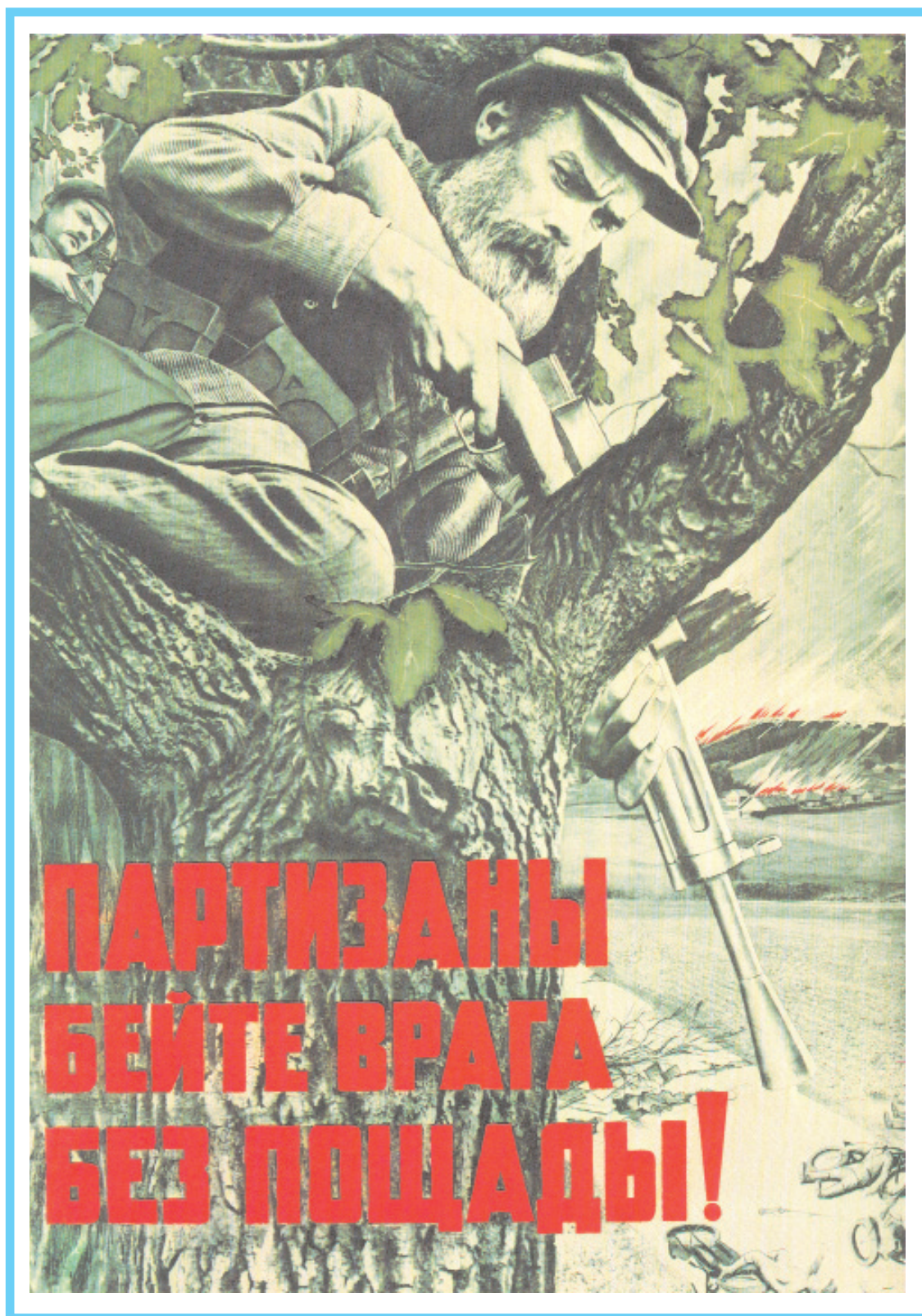
Плакат "Партизаны бейте врага без пощады!". Художники В. Б. Корецкий, В. А. Гицевич, 1941 г.