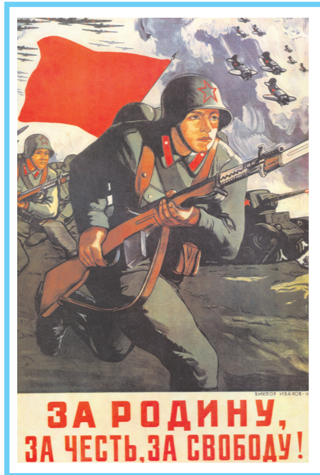
Плакат "За Родину, за честь, за свободу!". Художник В. С. Иванов, 1941 г.

В 1942-м тематика меняется. Плакаты показывают страдания советских людей под пятой оккупантов, их протест и борьбу, призывают к их освобождению и спасению от фашистской неволи. Плакаты стали горном, зовущим мстить гитлеровцам за поруганную землю, за смерть матерей, детей, стариков. Свет увидели плакаты: "Воин Красной Армии, спаси!" (В. Б. Корецкий), "Отомсти!" (Дементий Алексеевич Шмаинов), "Со-