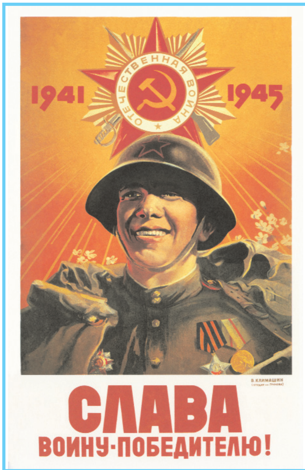
Плакат "Слава воину-победителю!". Художник В. С. Климашин, 1945 г.