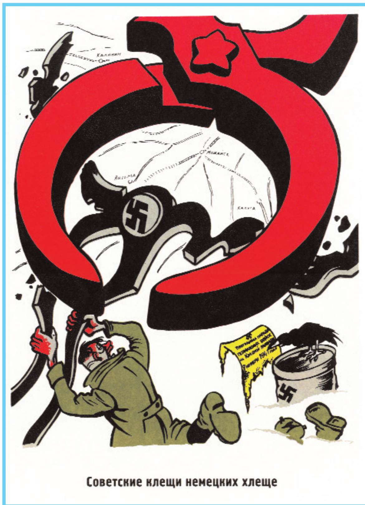
Плакат "Советские клещи немецких хлеще". Художник Б. Е. Ефимов, 1942 г.