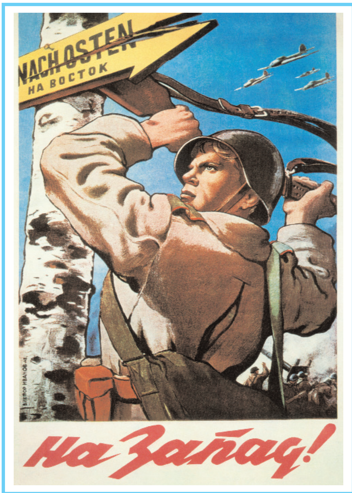
Плакат "На Запад!". Художник В. С. Иванов, 1943 г.