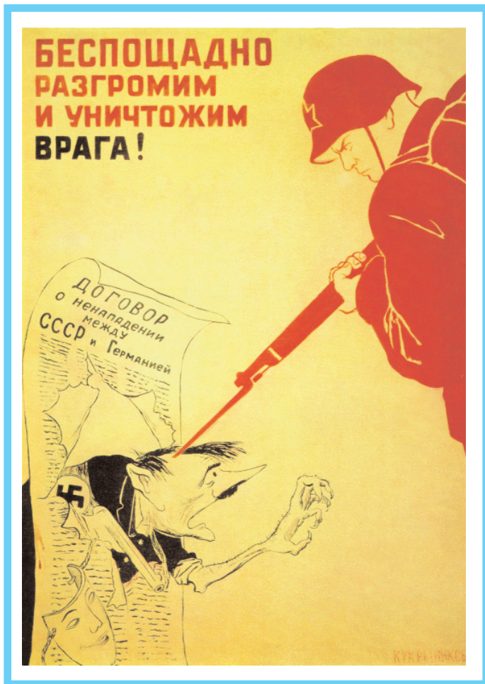
Плакат "Беспощадно разгромим и уничтожим врага!". Кукрыниксы, 1941 г.

зарисовки систематически публиковали многие газеты и журналы.